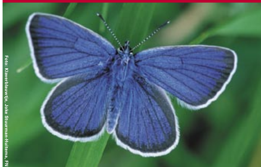
Foto: Klaverblauwtje

De Waddenvereniging deelt sinds 1997 in de opbrengst van de Nationale Postcode Loterij, de grootste goede doelenloterij van Nederland. Afgelopen jaar ontving de Waddenvereniging een bijdrage van 1,5 miljoen euro. Hiermee kan de vereniging nog meer campagnes en activiteiten starten!